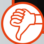
Standard-Schweißbrenner: Starke Rauchentwicklung!